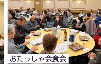
おたっしや会食会