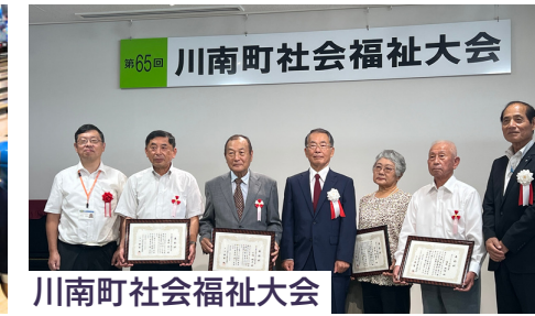
川南町社会福祉大会