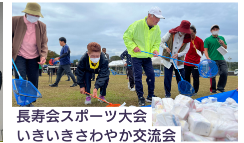
長寿会スポーツ大会 いきいきさわやか交流会