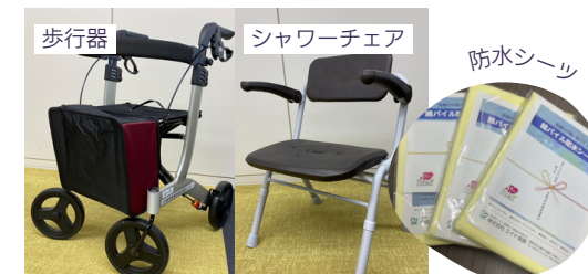
福祉用具貸出事業