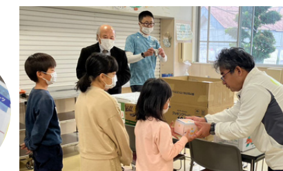
金鈴学園慰問事業