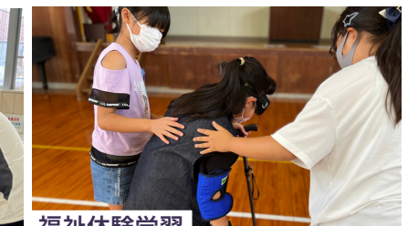
福祉体験学習 (高齢者疑似体験セット)

川南町共同募金委員会では、これからも皆様からいただくあたたかいご支援を、たくさんの方々にお届けしたいと思っています。今後とも赤い羽根共同募金にご協力いただきますようよろしくお願い申し上げます。