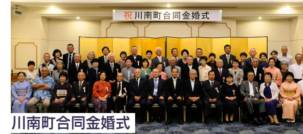
川南町合同金婚式